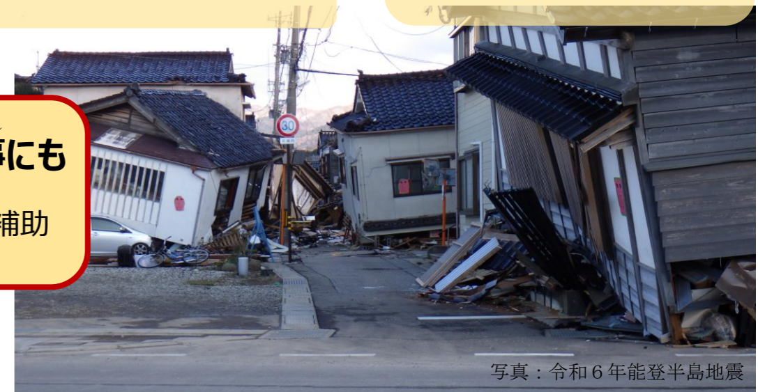
写真：令和6年能登半島地震